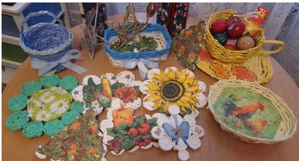
príloha č. 3