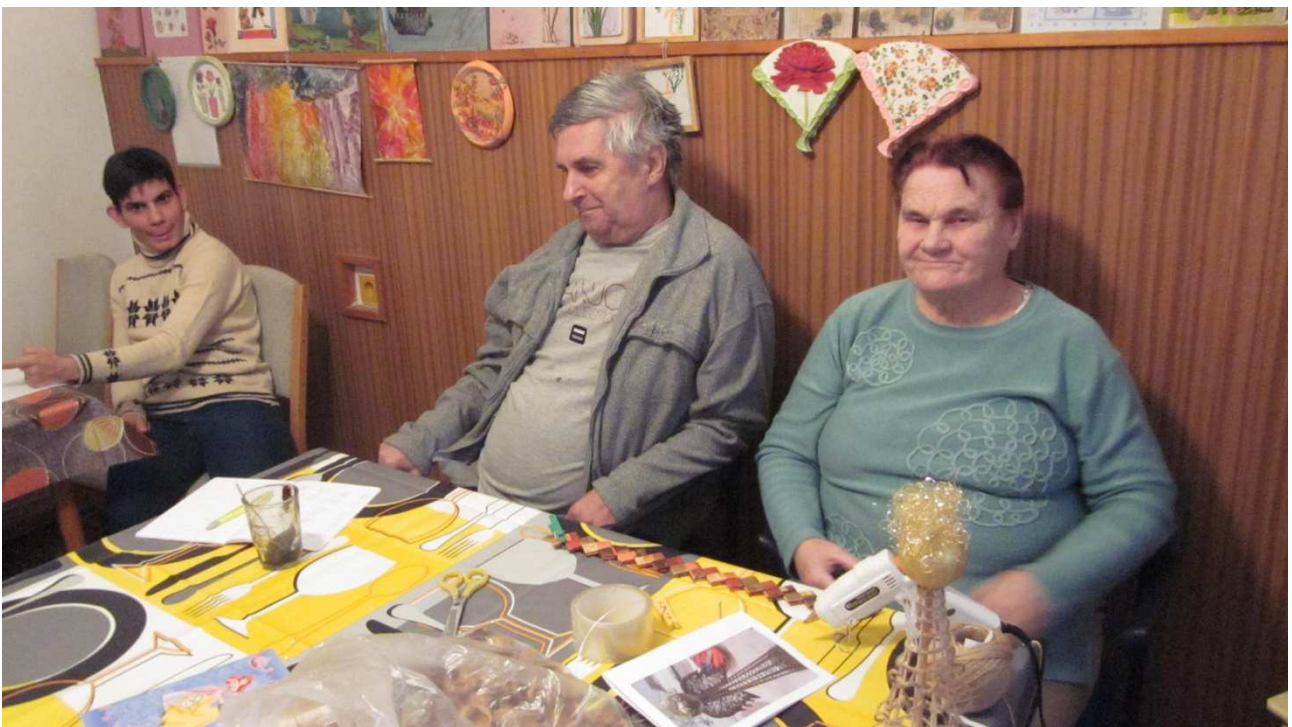
príloha č. 5