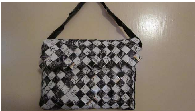
príloha č. 2