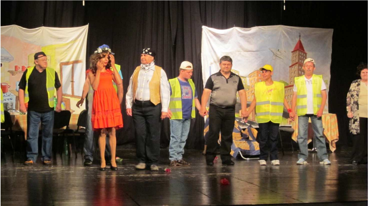
príloha č. 6