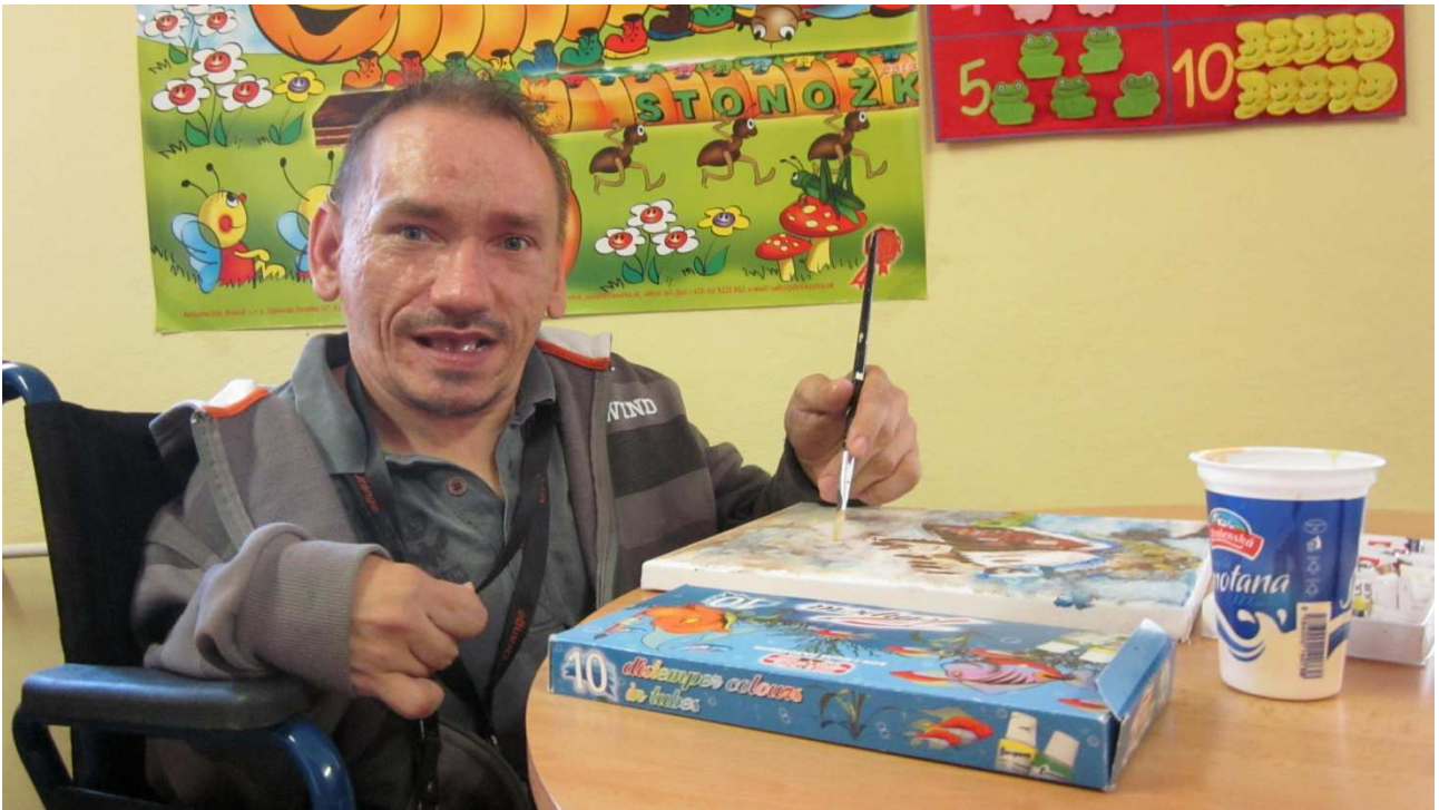
príloha č. 4