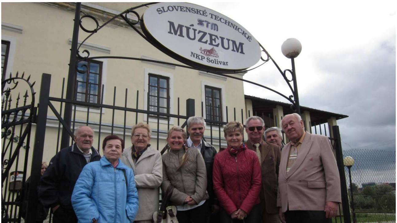
príloha č. 1