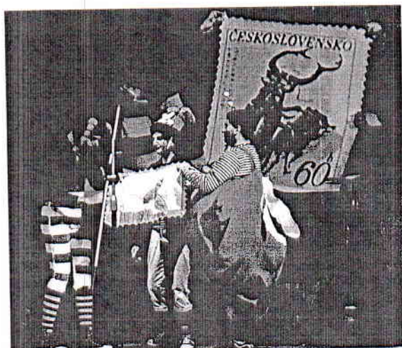
Svetielko, Strážske – Návrat troch chrobákov

ĽUBICA BEKÉNIOVÁ