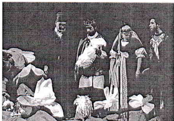
ŠZŠ, Bardejov – Biela fialka