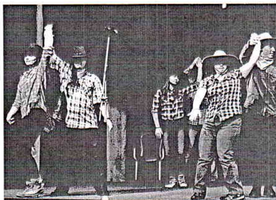
DSS Anima, Michalovce – Country tanec

Deti, mladí ľudia aj dospelí so špeciálnymi výchovno-vzdelávacími potrebami potrebujú facilitáciu na získanie emocionálneho bezpečia a istoty, podporu komunikačnej a prezentačnej odvahy, často aj pri orientácii v priestore javiska, schopnosti komunikovať s publikom, pri adresovaní svojej výpovede, ako aj pri pamäťovom zlyhaní, a to nielen v prípade textu, ale aj konania, interakcie a podobne. Pre pedagóga je ideálne zvoliť si univerzálnu rolu, napríklad slniečko, vietor, motýľ a podobne, teda takú, ktorá prirodzene vyplýva z predlohy a umožní pohyb pedagóga v role s cieľom zasahovať, pomáhať, viesť, riadiť tam, kde je to potrebné, aby došlo k želaným zmenám v osobnostnom napredovaní zverencov a aby sa minimalizoval ich stres z prezentovania pred publikom.