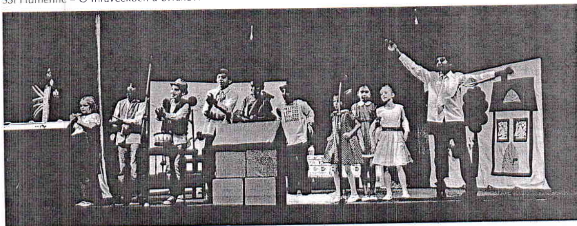
SŠI Vranov nad Topľou – Čin-Čin

Teatroterapia predstavuje nový fenomén; objavuje sa v kultúrnom živote Európy od konca sedemdesiatych rokov a spája umeleckú výchovu a terapiu. Pre členov súboru je pôsobenie v divadle vlastne terapiou divadelným umením. Pre kvalitnú prácu vedúcich súborov je však potrebné osvojiť si značnú sumu poznatkov z fungovania divadla alebo poznať aspoň