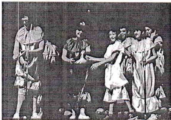
DDS Vranov nad Topľou – Dúhové bonbóny