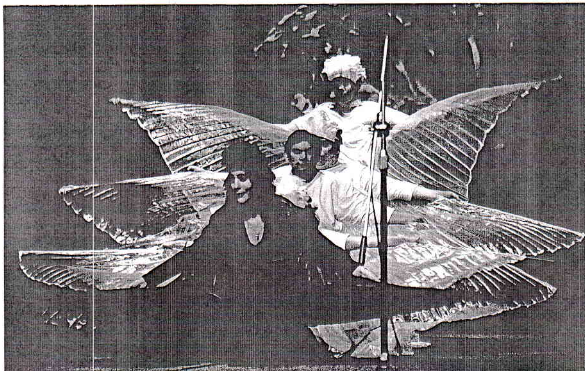
Rakovčanka, Rakovec nad Ondavou – Labutí príbeh

z pôvabnej knihy Ľudmily Podjavorinskej si zvolili vhodnú a pre deti príťažlivú časť Pytačky. Na oznamovanie dôležitých faktov využili postavu bubeníka, čo bol veľmi dobrý a zážitkový spôsob akcelerovania deja. Temporytmus predstavenia súbor vynikajúco zvládol a celok vtipne vygradoval.